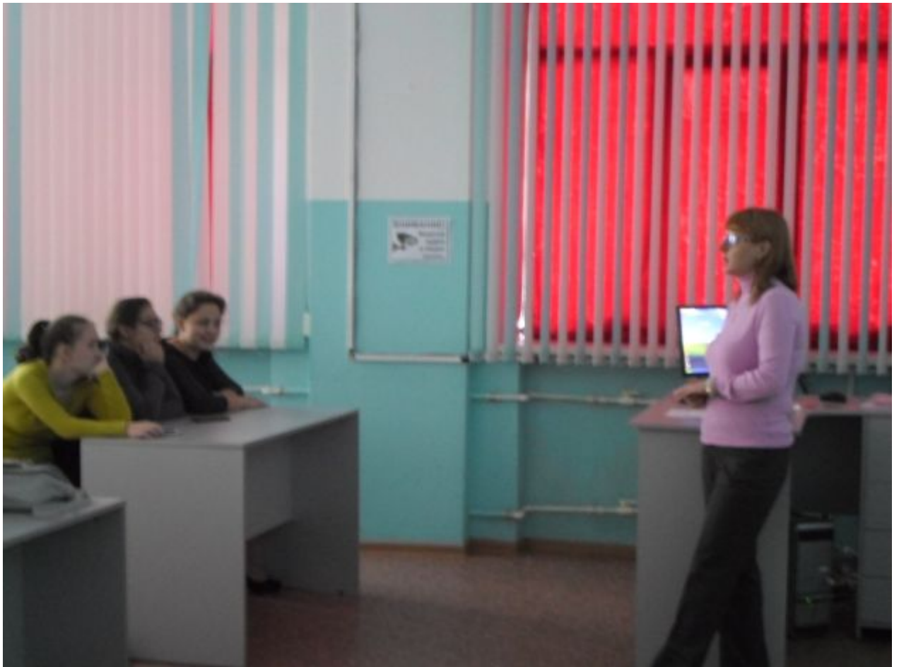
Первокурсники задумались «Что такое свобода?»