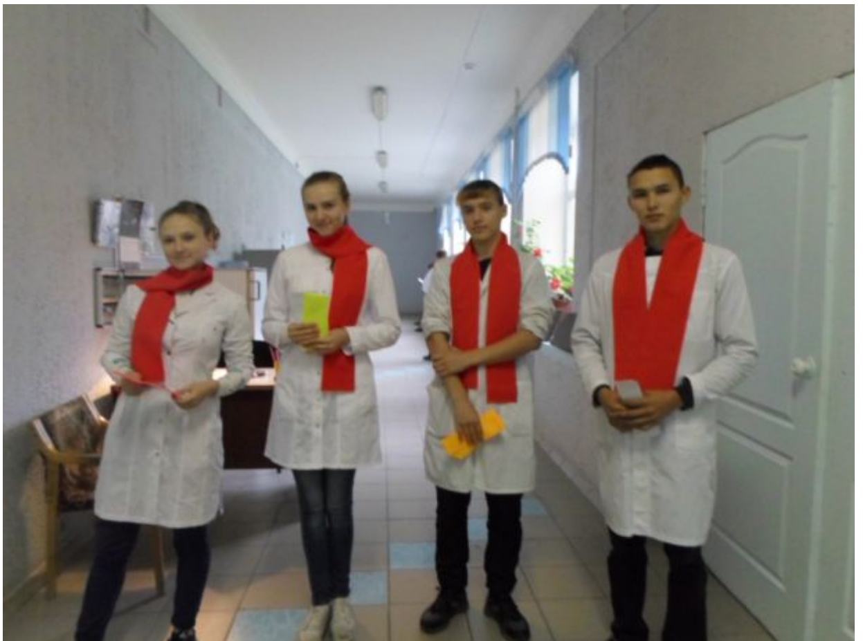
Студенты второго и четвертого курсов призывают задуматься о вреде алкоголя